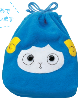
ひつじ (ライトブルー)