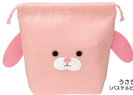
うさぎ (パステルピンク)