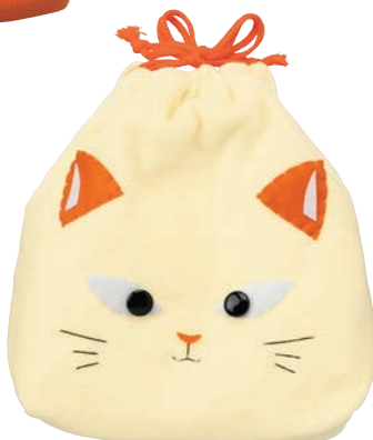
ネコ (パステルイエロー)