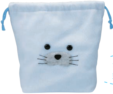
アザラシ (パステルブルー)