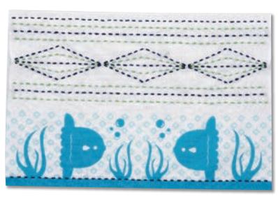
まんぼうとダイヤつなぎ 糸の色：黄緑・紺