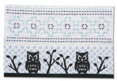
ふくろうと角十つなぎ 糸の色：水色・紺