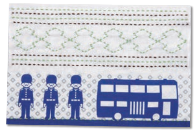
へいたいと二重菱形つなぎ 糸の色：黄緑・紺