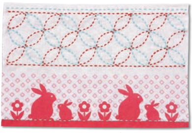
うさぎと七宝 糸の色：水色・赤