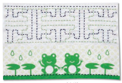
かえると紗綾形 糸の色：黄緑・紺