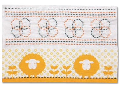
ひつじと花つなぎ 糸の色：オレンジ・緑