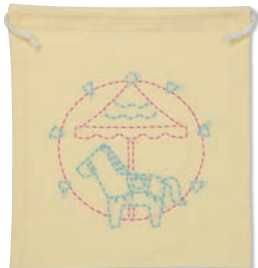
メリーゴーランド 糸の色：水色・ピンク