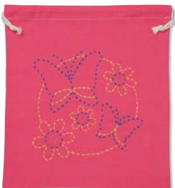
ちょうちよとお花 糸の色：青・黄