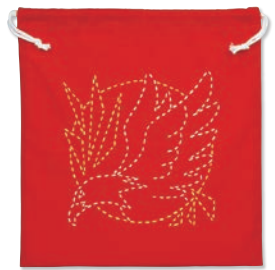
イーグル 糸の色：白・黄