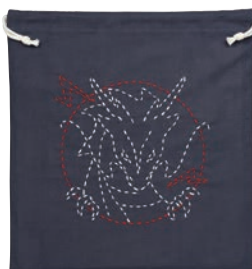
ドラゴン 糸の色：白・赤