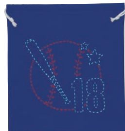
ベースボール 糸の色：赤・水色