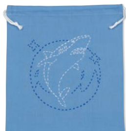
ジョーズと海 糸の色：白・青