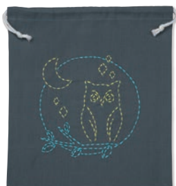
夜のふくろう 糸の色：黄・水色