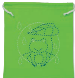
かえるの雨やどり 糸の色：青・白