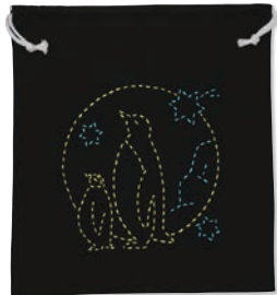
ペンギンのおやこ 糸の色：黄・水色