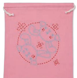
うさぎのかくれんぼ 糸の色：水色・赤