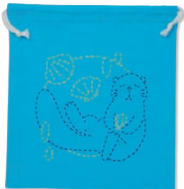
ラッコのおうち 糸の色：青・黄