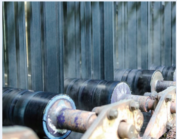
糸をロープ状にして藍染めを施す。日本ではわずか4社でしかこの作業を行っていない。