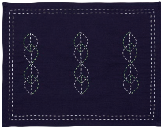
【作品例】 刺し子糸 101 番・105 番