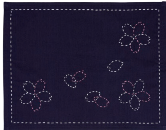
【作品例】 刺し子糸 101 番・111 番