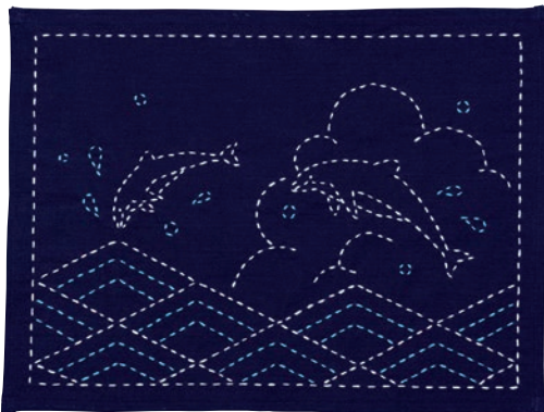
イルカと菱青海波 糸の色：白・水色