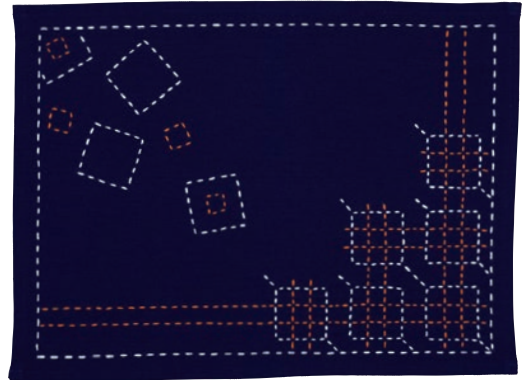
正方形と格子つなぎ 糸の色：オレンジ・白