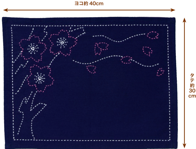
桜の木 糸の色：白・ピンク