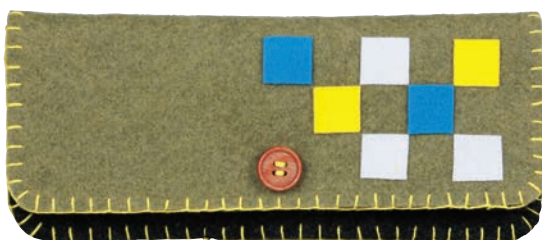
オリーブ/ブラック 糸の色: 黄色