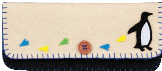
アイボリー/ブラック 糸の色: 青