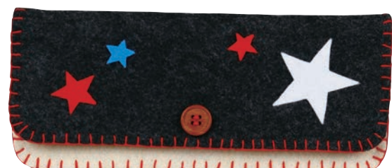
ブラック/アイボリー 糸の色: 赤