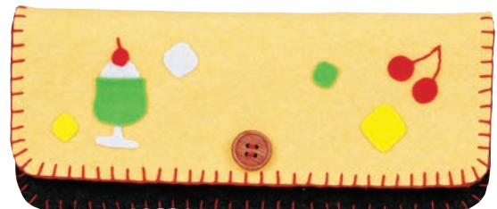
イエロー/ブラック 糸の色: 赤