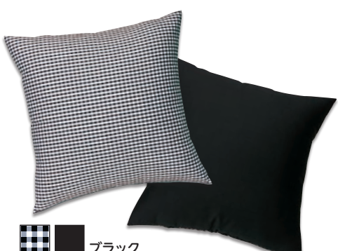
■ ■ ブラック