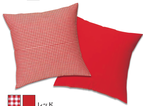
■ ■ レッド