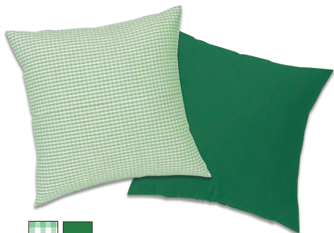
■ ■ グリーン