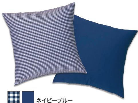
■ ■ ネイビーブルー