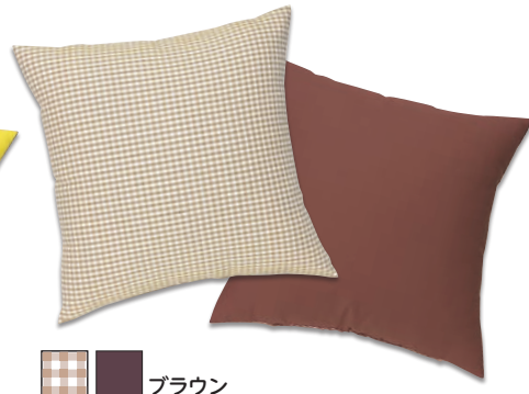
■ ■ ブラウン