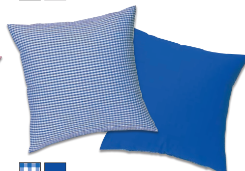
■ ■ ブルー