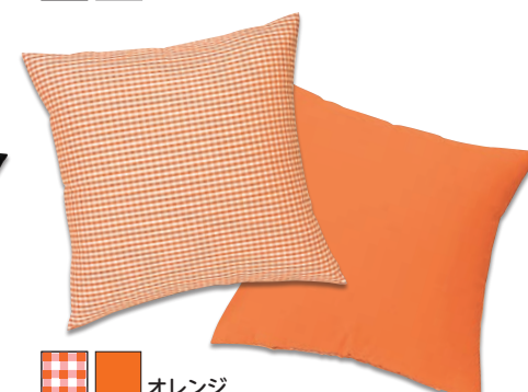
■ ■ オレンジ