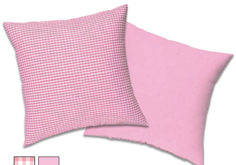
■ ■ パステルピンク