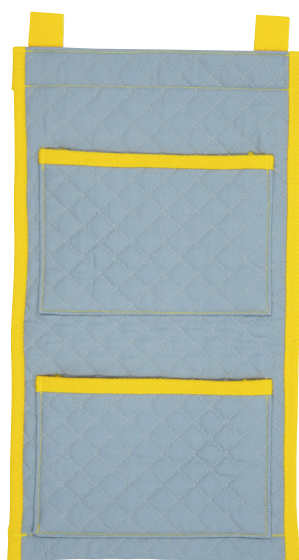
グレー テープ色：イエロー