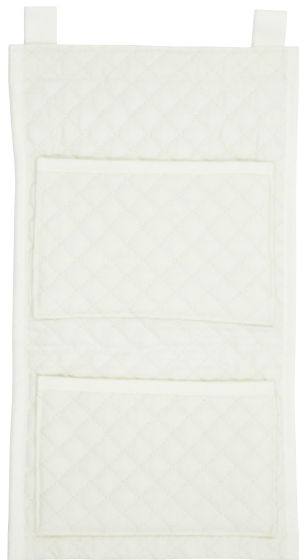
きなり テープ色：きなり