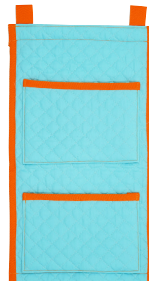
スカイブルー テープ色：オレンジ