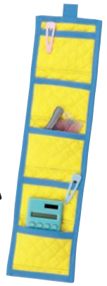
サイズ/ 約 45 × 10.5cm