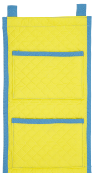
イエロー テープ色：サックス