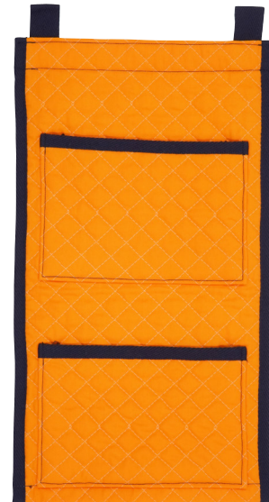
オレンジ テープ色：ネイビー