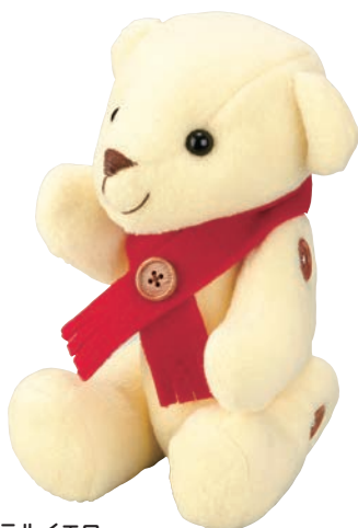
パステルイエロー