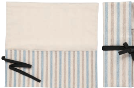
ストライプ柄 (サックス/ベージュ)