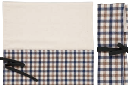
チェック柄 (ネイビー/ブラウン)