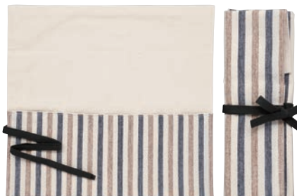
ストライプ柄 (ネイビー/ブラウン)