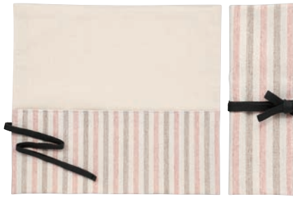
ストライプ柄 (ピンク/ベージュ)