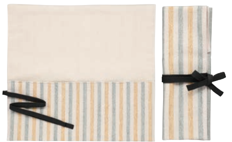
ストライプ柄 (グリーン/イエロー)